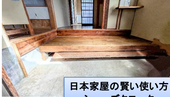
日本家屋の賢い使い方 シューズクローク