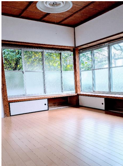
4連サッシが光をふんだんに取り込みまるで外にいるかのように思わせてくれます。