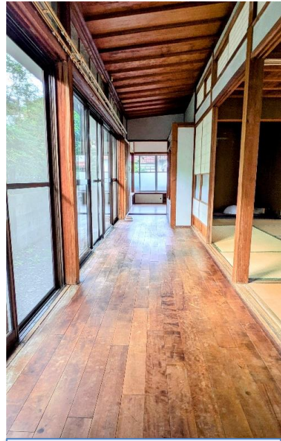
屋久杉造りの家・趣があります