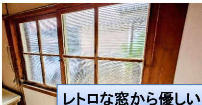
レトロな窓から優しい