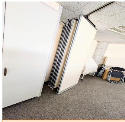
パーティションで2分割できる